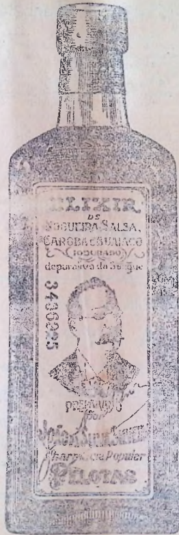
O ELINIR DE NOGUEIRA

TELEPHONE NORTE N. 4695 Endereço telegr. "KOSINSKI"—RIO