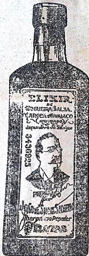
O ELIXIR DE NOGUEIRA

TELEPHONE NORTE N. 4629 Endereço teleg. "KOSINSKI"—110